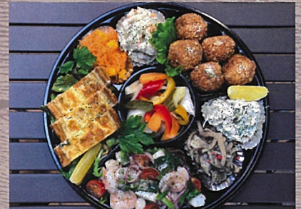
パーティーオードブル