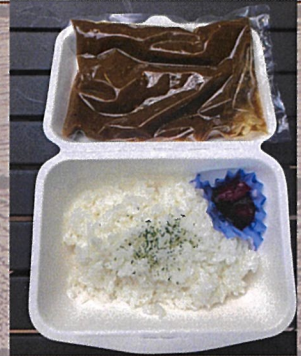
しょうが焼き弁当